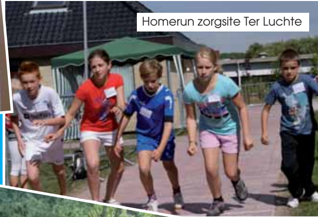
Homerun zorgsite Ter Luchte