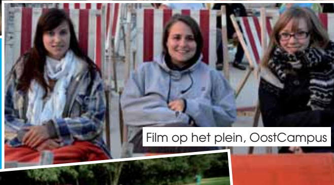
Film op het plein, OostCampus