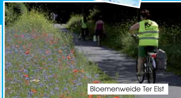
Bloemenweide Ter Elst