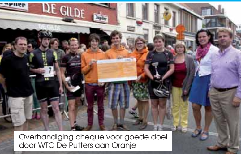
Overhandiging cheque voor goede doel door WTC De Putters aan Oranje