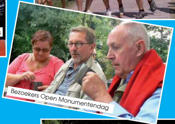
Bezoekers Open Monumentendag