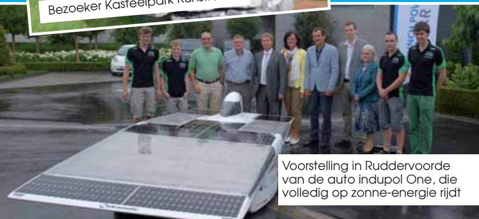
Voorstelling in Ruddervoore van de auto indupol One, die volledig op zonne-energie rijdt