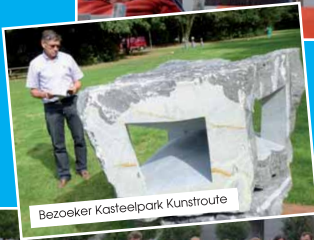
Bezoeker Kasteelpark Kunstroute