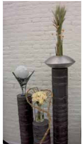
Lut Allemeersch 27 september – 30 oktober | bloemsierkunst | De Valkaart