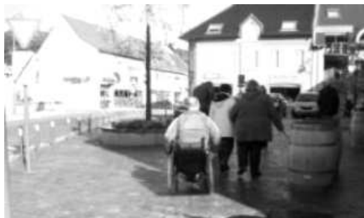
Knelpuntwandeling – centrum Ruddervoorde