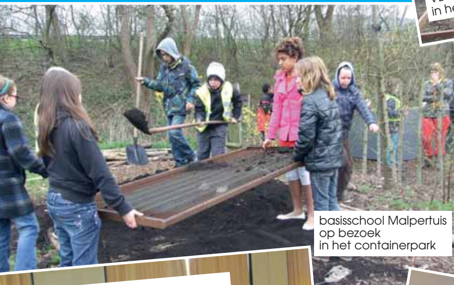
basisschool Malpertuis op bezoek in het containerpark