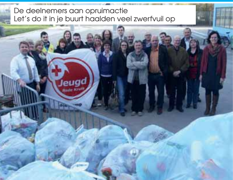
De deelnemers aan opruimactie Let's do it in je buurt haalden veel zwerfvuil op