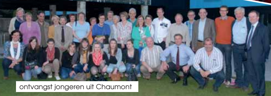
ontvangst jongeren uit Chaumont