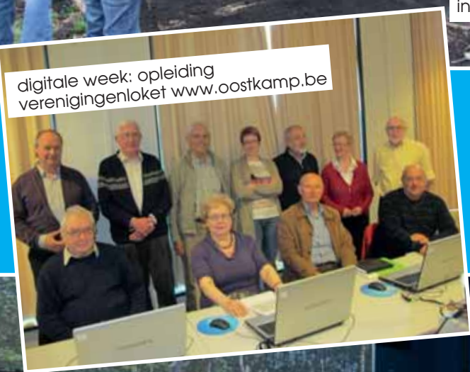
digitale week: opleiding verenigingsloket www.oostkamp.be