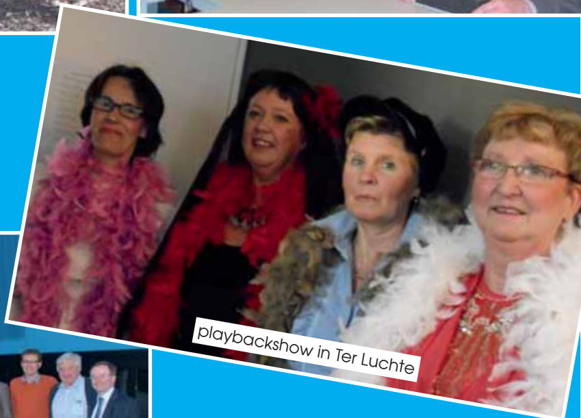
playbackshow in Ter Luchte