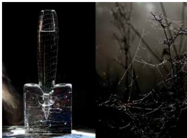
Laura Geldof | fotografie | 4 juni – 1 juli | Bibliotheek-infopunt