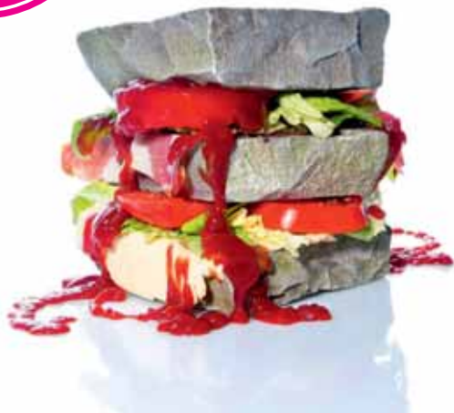
Dirk Galle | fotografie | 1-27 juni | De Valkaart