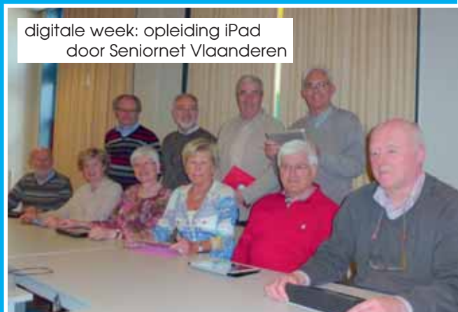
digitale week: opleiding iPad door Seniornet Vlaanderen