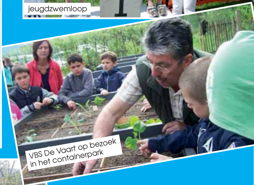
VBS De Vaart op bezoek in het containerpark