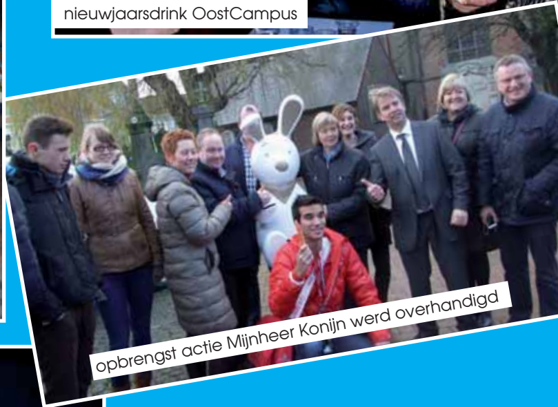
opbrengst actie Mijnheer Konijn werd overhandigd