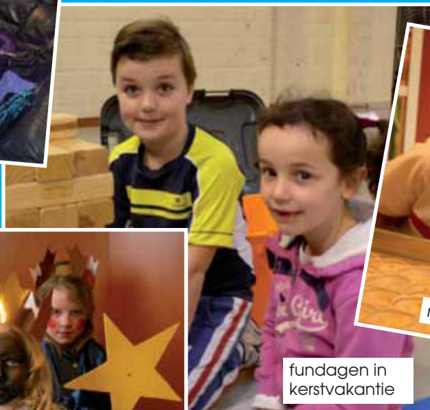
fundagen in kerstvakantie