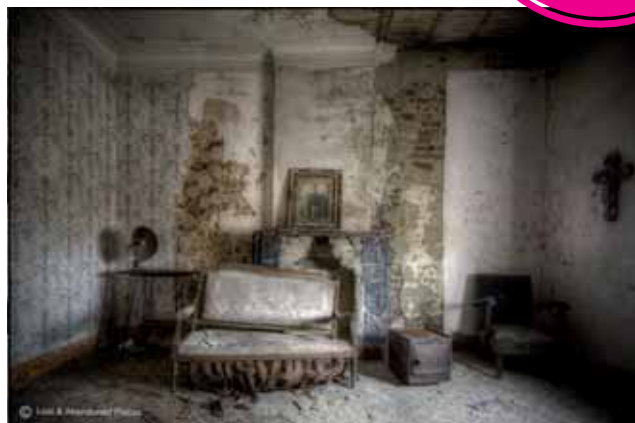
Kurt Gielen | fotografie | 3 t.e.m. 28 februari De Valkaart