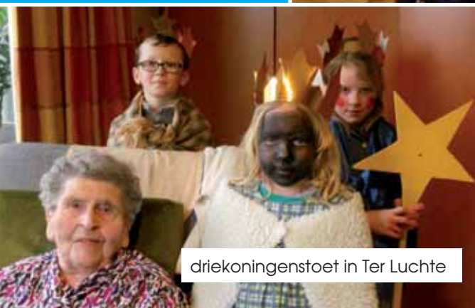
driekoningenstoet in Ter Luchte