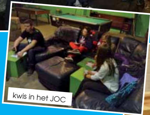
kwis in het JOC