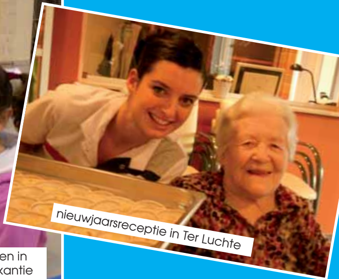
nieuwjaarsreceptie in Ter Luchte