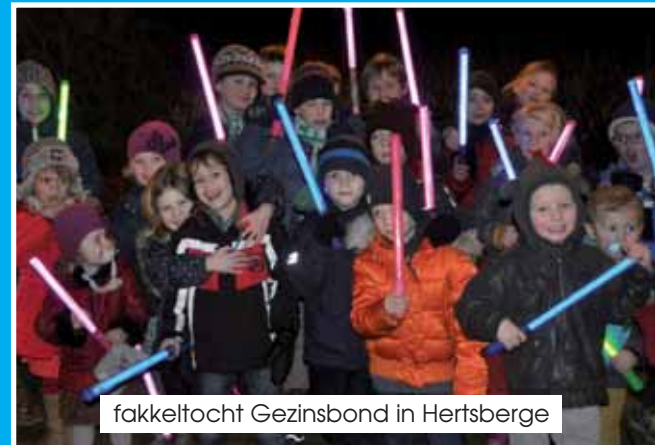
fakkeltocht Gezinsbond in Hertsberge