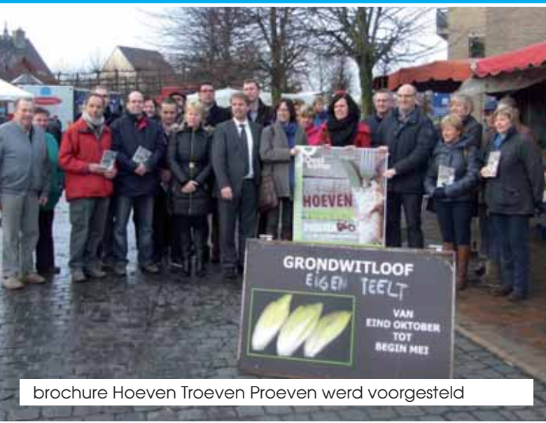
brochure Hoeven Troeven Proeven werd voorgesteld