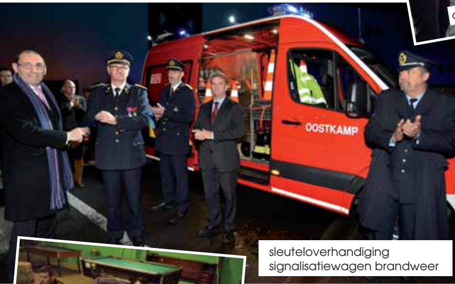
sleuteloverhandiging signalisatiewagen brandweer