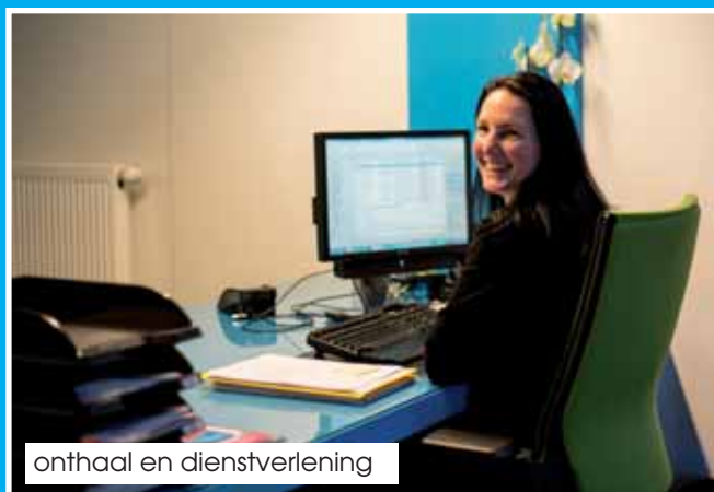
onthaal en dienstverlening