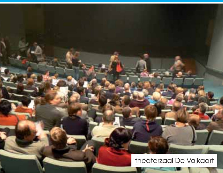
theaterzaal De Valkaart