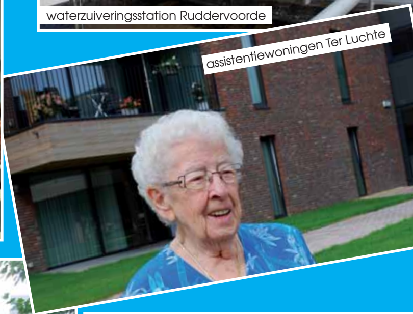
assistentiewoningen Ter Luchte